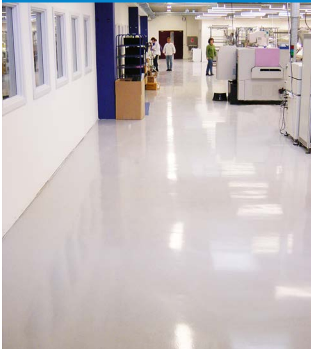
Underhållsfritt ESD golv på Protec, Danmark.