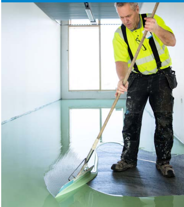
Stegljudsdämpande golv i Sydhavsskolens nya moderna lokaler, Köpenhamn.